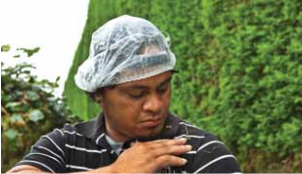
ਬਗੀਚੇ ਤੋਂ ਜਾਣ ਤੋਂ ਪਹਿਲਾਂ ਸਾਰੇ ਕੱਪੜਿਆਂ, ਸਿਰ ਦੇ ਕੱਪੜੇ ਅਤੇ ਜੁੱਤੀਆਂ ਤੋਂ ਪੌਦਿਆਂ ਦੀ ਸਮੱਗਰੀ ਅਤੇ ਮਿੱਟੀ ਸਾਫ਼ ਕਰ ਦਿਓ