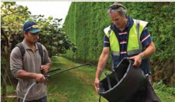
ਬਗੀਚੇ ਤੋਂ ਬਾਹਰ ਜਾਣ ਤੋਂ ਪਹਿਲਾਂ ਬਗੀਚੇ ਦੇ ਸਾਰੇ ਉਪਕਰਣ ਨੂੰ ਕੀਟਾਣੂ-ਮੁਕਤ ਕਰੋ