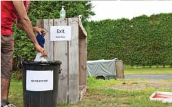
ਵਰਤ ਕੇ ਸੁੱਟ ਦਿੱਤੇ ਜਾਣ ਵਾਲੇ ਸਾਰੇ ਕੱਪੜੇ ਬਗੀਚੇ ਵਿੱਚ ਛੱਡ ਦਿਓ