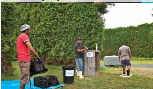
ਕਿਸੇ ਵੀ ਕਾਰਨ ਕਰਕੇ ਬਗੀਚੇ ਤੋਂ ਜਾਣ ਅਤੇ ਵਾਪਸ ਆਉਣ 'ਤੇ ਸਾਫ-ਸਫਾਈ ਦੀਆਂ ਪ੍ਰਕਿਰਿਆਵਾਂ ਨੂੰ ਦੁਹਰਾਓ