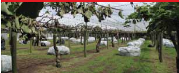
Psa-V ਨਾਲ ਤਬਾਹ ਹੋਏ ਬਗੀਚੇ ਨੂੰ ਵੱਖਰਾ ਕਰ ਦਿਓ

Psa-V ਕੀਵੀਫਰੂਟ ਵੇਲ ਦੀ ਇੱਕ ਤਬਾਹੀ ਲਿਆਉਣ ਵਾਲੀ ਬਿਮਾਰੀ ਹੈ ਅਤੇ ਸਾਡੀ ਰੋਜ਼ੀ-ਰੋਟੀ ਲਈ ਖਤਰਾ ਹੈ। ਸਾਨੂੰ ਸਾਰਿਆਂ ਨੂੰ ਭਵਿੱਖ ਵਾਸਤੇ ਆਪਣੇ ਉਦਯੋਗ ਦੀ ਰੱਖਿਆ ਕਰਨ ਲਈ ਕੰਮ ਕਰਨ ਦੀ ਲੋੜ ਹੈ।