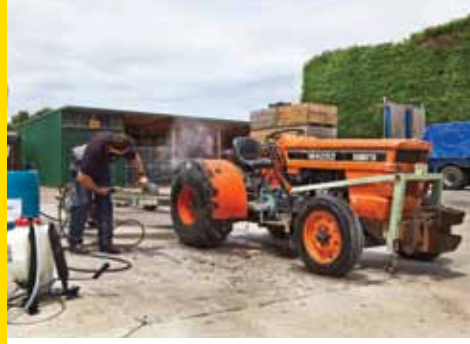
ਬਗੀਚੇ ਵਿੱਚ ਦਾਖਲ ਹੋਣ ਅਤੇ ਇਸ ਤੋਂ ਬਾਹਰ ਨਿਕਲਣ ਤੋਂ ਪਹਿਲਾਂ ਮਸ਼ੀਨਰੀ ਅਤੇ ਉਪਕਰਣ ਨੂੰ ਧੋਣ ਵਾਲੇ ਖੇਤਰ ਵਿੱਚ ਸਾਫ਼ ਕਰੋ