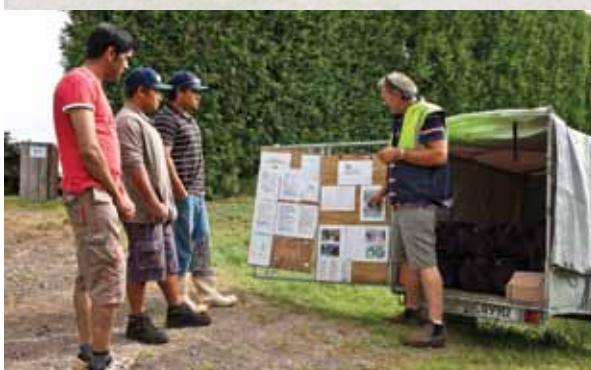
ਸਾਰੇ ਸਮਿਆਂ 'ਤੇ ਬਗੀਚੇ ਵਿੱਚ ਸਾਫ-ਸਫਾਈ ਦੇ ਨਿਯਮਾਂ ਦੀ ਪਾਲਣਾ ਕਰੋ