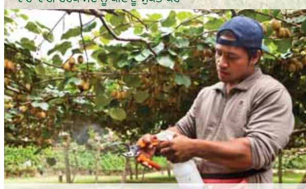
ਜੇ ਬਗੀਚੇ ਦੇ ਸੰਦਾਂ ਦਾ ਇੱਕ ਸੈਟ ਵਰਤ ਰਹੇ ਹੋ, ਤਾਂ ਵੇਲਾਂ ਦੇ ਵਿਚਕਾਰ ਚੰਗੀ ਤਰ੍ਹਾਂ ਧੋਵੋ