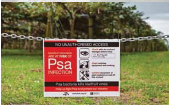
ਕੀਵੀਫਰੂਟ ਦੇ ਬਗੀਚਿਆਂ ਤਕ ਬਿਨਾਂ ਅਧਿਕਾਰ ਦੇ ਕੋਈ ਪਹੁੰਚ ਨਹੀਂ