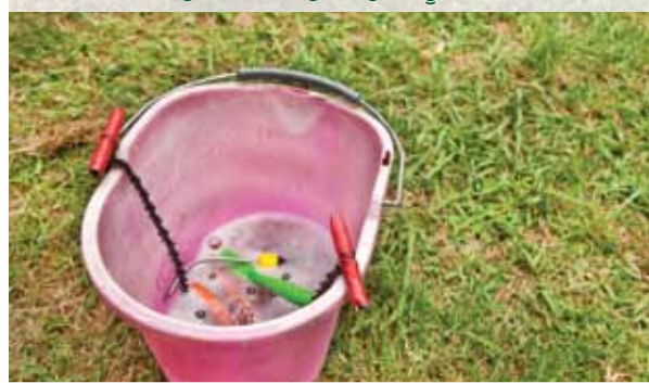
ਜੇ ਸੰਭਵ ਹੋਵੇ ਤਾਂ ਸੰਦਾਂ ਦੇ ਦੋ ਸੈਟਾਂ ਦੀ ਵਰਤੋਂ ਕਰੋ ਅਤੇ ਵੇਲਾਂ ਦੇ ਵਿਚਕਾਰ ਵਾਰੇ-ਵਾਰੀ ਹਰੇਕ ਸੰਦ ਨੂੰ ਕੀਟਾਣੂ-ਮੁਕਤ ਕਰੋ