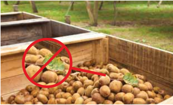
ਯਕੀਨੀ ਬਣਾਓ ਕਿ ਫਲ ਪਾਉਣ ਵਾਲੇ ਡੱਬਿਆਂ ਅਤੇ ਬੈਗਾਂ ਵਿੱਚ ਪੌਦਿਆਂ ਦੀ ਕੋਈ ਸਮੱਗਰੀ ਨਾ ਹੋਵੇ