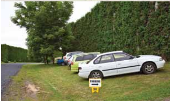
ਵਾਹਨਾਂ ਨੂੰ ਕੀਵੀਫਰੂਟ ਦੀਆਂ ਵੇਲਾਂ ਤੋਂ ਦੂਰ ਨਿਰਧਾਰਿਤ ਖੇਤਰ ਵਿੱਚ ਪਾਰਕ ਕਰੋ