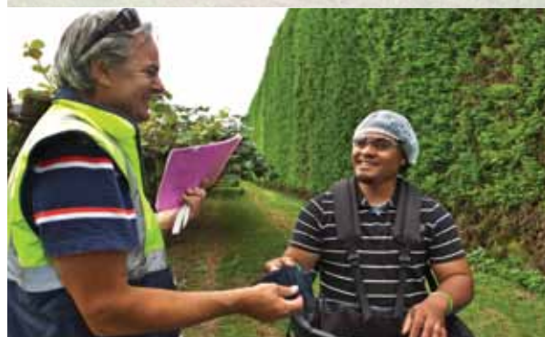
ਜੇ ਸੰਭਵ ਹੋਵੇ ਬਗੀਚੇ ਵਿੱਚ ਮੁਹੱਈਆ ਕੀਤੇ ਸੰਦ ਅਤੇ ਉਪਕਰਣ ਦੀ ਵਰਤੋਂ ਕਰੋ