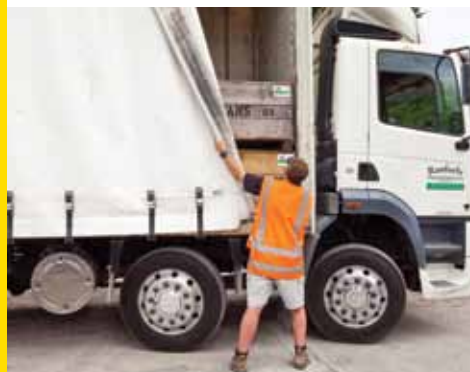
ਕੀਵੀਫਰੂਟ ਦੇ ਨੰਗੇ ਲੇਡ ਨੂੰ ਢੱਕ ਦਿਓ