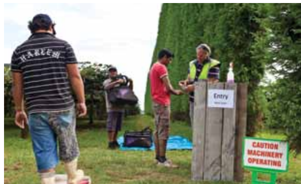
ਬਗੀਚੇ ਵਿੱਚ ਵੜਨ ਅਤੇ ਬਾਹਰ ਨਿਕਲਣ ਤੋਂ ਪਹਿਲਾਂ ਜੁੱਤੇ ਅਤੇ ਹੱਥ ਸਾਫ ਕਰੋ