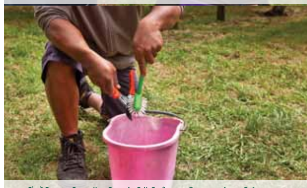
ਤੁਸੀਂ ਪੈਦਿਆਂ ਦੀ ਸਮੱਗਰੀ ਅਤੇ ਮਿੱਟੀ ਨੂੰ ਹਟਾਉਣ ਵਾਸਤੇ ਬਗੀਚੇ ਵਿੱਚ ਜੋ ਸੰਦ ਅਤੇ ਉਪਕਰਣ ਲਿਆਉਂਦੇ ਹੋ ਉਹਨਾਂ ਨੂੰ ਸਾਫ ਕਰੋ