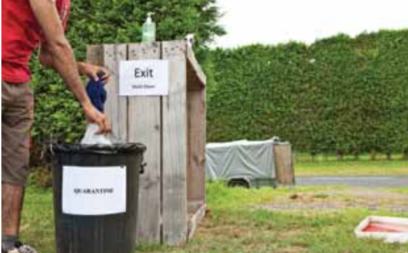
ਵਰਤ ਕੇ ਸੁੱਟ ਦਿੱਤੇ ਜਾਣ ਵਾਲੇ ਸਾਰੇ ਕੱਪੜੇ ਬਗੀਚੇ ਵਿੱਚ ਛੱਡ ਦਿਓ