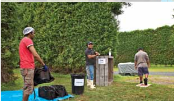
ਕਿਸੇ ਵੀ ਕਾਰਨ ਕਰਕੇ ਬਗੀਚੇ ਤੋਂ ਜਾਣ ਅਤੇ ਵਾਪਸ ਆਉਣ 'ਤੇ ਸਾਫ-ਸਫਾਈ ਦੀਆਂ ਪ੍ਰਕਿਰਿਆਵਾਂ ਨੂੰ ਦੁਹਰਾਓ