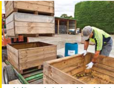
ਬਗੀਚੇ ਵਿੱਚ ਦਾਖਲ ਹੋਣ ਤੋਂ ਪਹਿਲਾਂ ਯਕੀਨੀ ਬਣਾਓ ਕਿ ਸਾਰੇ ਡੱਬੇ ਅਤੇ ਉਪਕਰਣ ਪੈਦਿਆਂ ਦੀ ਸਮੱਗਰੀ ਤੋਂ ਮੁਕਤ ਹੋਣ